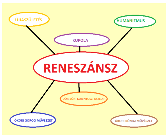
5. OSZTÁLY: PAINT